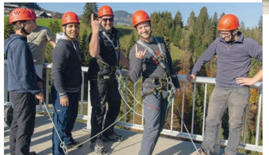
SPORT & FREIZEIT